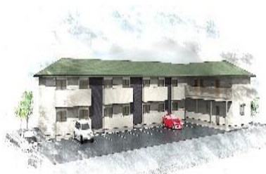
第一 KI ビル（博多区下月隈）