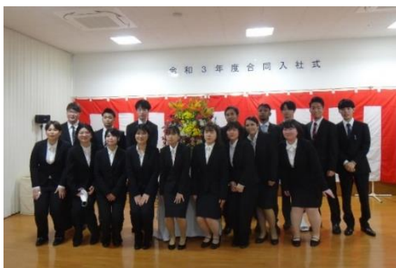
令和 3 年度新卒者 17 名