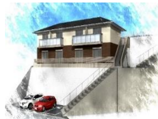
大池 KI ビル（南区大池）