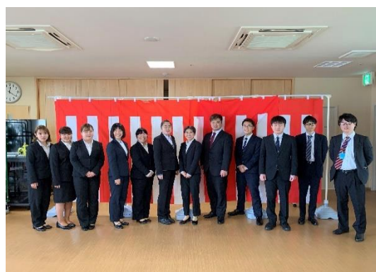
令和 2 年度新卒者 12 名