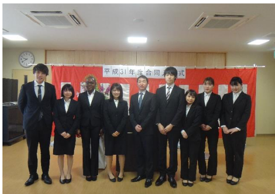
平成 31 年度新卒者 9 名