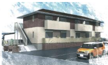
第二 KI ビル（西区野方）