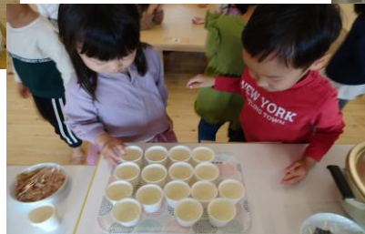
和出汁の飲みくらべ