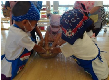
さつまいもクッキング

愛着形成の個別援助体制として緩やかな育児担当保育を行い、食事介助には毎日、特定の保育士が関わるようにし、安定した環境の中での食事、排泄の手助けを行っていきます。