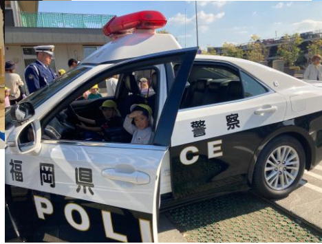
パトカーと 白バイの見学