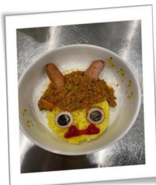
節分のおにさんカレー