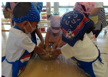
さつまいもクッキング

愛着形成の個別援助体制として緩やかな育児担当保育を行い、食事介助には毎日、特定の保育士が関わるようにし、安定した環境の中での食事、排泄の手助けを行っていきます。