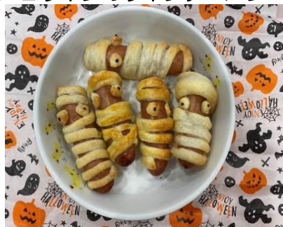
ハロウィンのウィンナーパン