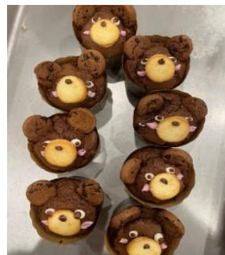
くまさんマフィン