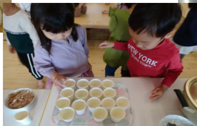
和出汁の飲み比べ